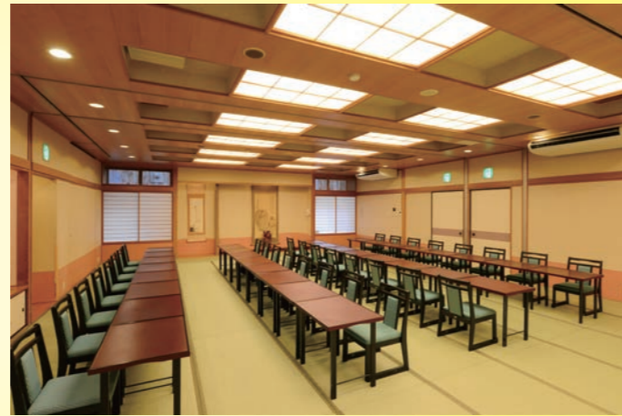
宴会場は椅子テーブル対応可