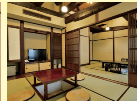
山ぼうし庵【ちごゆり】