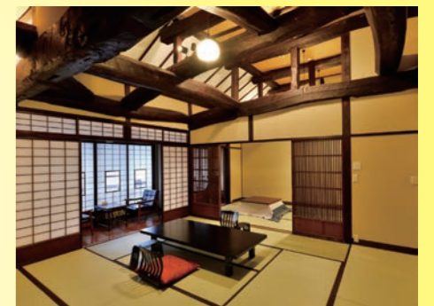
山ぼうし庵【ひとり静】