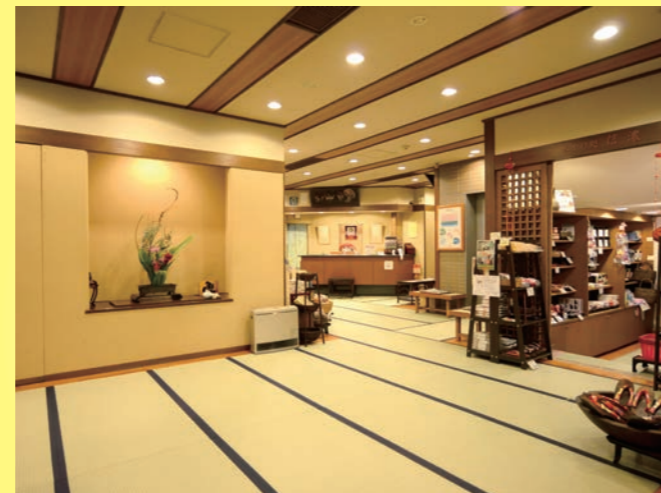
館内は全て畳敷き 素足でお寛ぎいただけます