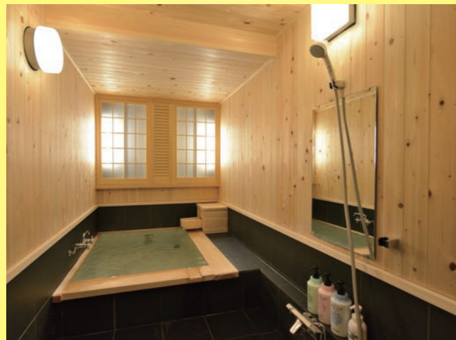
貸切家族風呂 1回45分2,200円 要予約