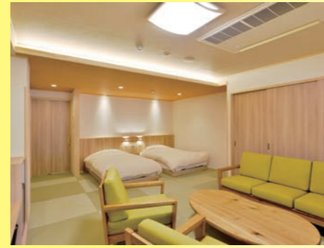
7月リニューアル かけ流し温泉付 和室ベッド客室 16畳