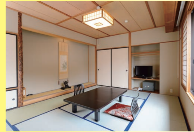
スタンダード客室