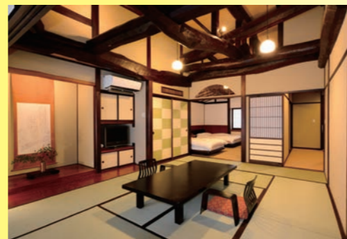
山ぼうし庵【福寿草】 温泉付

《山ぼうし庵》の木造建築は、移築ではなく、明治初期に県下一円から材木を集め建てた当時の建物です。江戸時代からの歴史を刻んだ梁、重厚な古民家造りは、現代では再現不可能な歴史ある客室です。