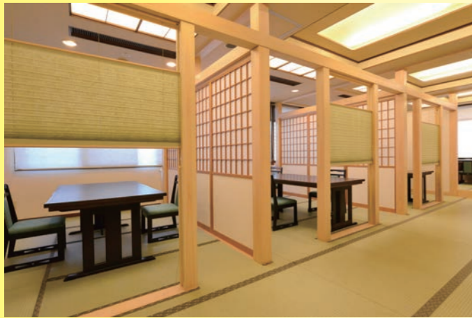
半個室食事処【花野】