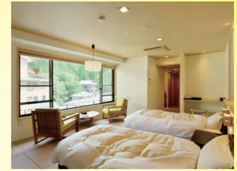
7月リニューアル かけ流し温泉付 和室ベッド客室 12畳